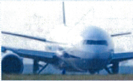
航空・宇宙・鉄道・船舶